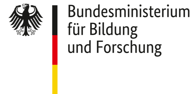
Anja Karliczeck Bundesministerin für Bildung und Forschung